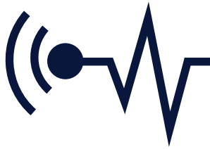
Przód / Front

Detector it's used to find the laser beam emitted by laser devices, which ensures maximum use of their working range.